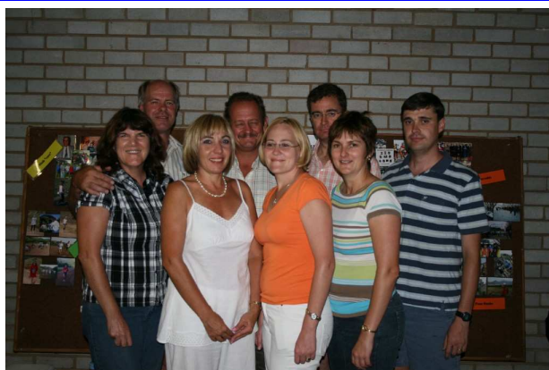
ONS BESTUUR VIR 2009